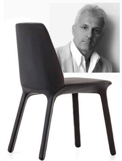
Di Mauro Lipparini la sedia Flute, in pelle, tessuto o ecopelle.

Per festeggiare l'ottantesimo compleanno di Bonaldo, il designer Alain Gilles ha disegnato un tavolo celebrativo, Mass Table, presentato all'ultimo Salone del Mobile milanese, con la base che ricorda da un lato le crinoline delle dame dell'alta società del 1800 e, dall'altro, il "wireframe" utilizzato per le progettazioni 3D. A ottant'anni, per restare in salute, si celebra sì il passato, ma soprattutto si gettano le basi per il futuro.